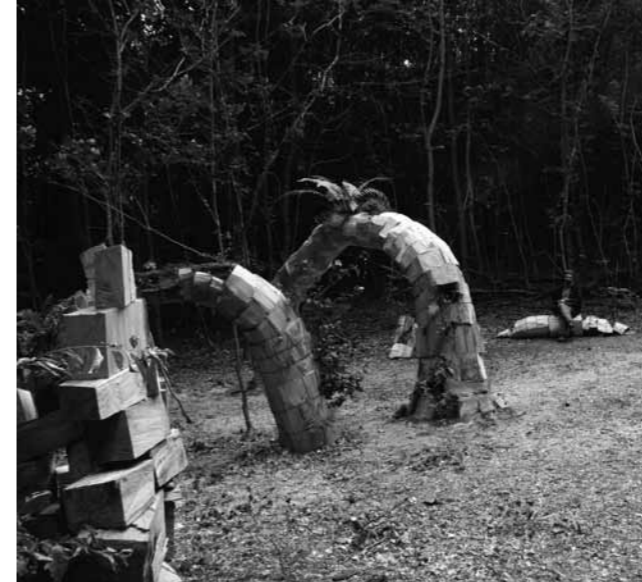
Rumen Dimitrov, Jardines colgantes - Metamorphosis / Hanging Gardens - Metamorphoses (2014). Plantas y madera / plants and wood.