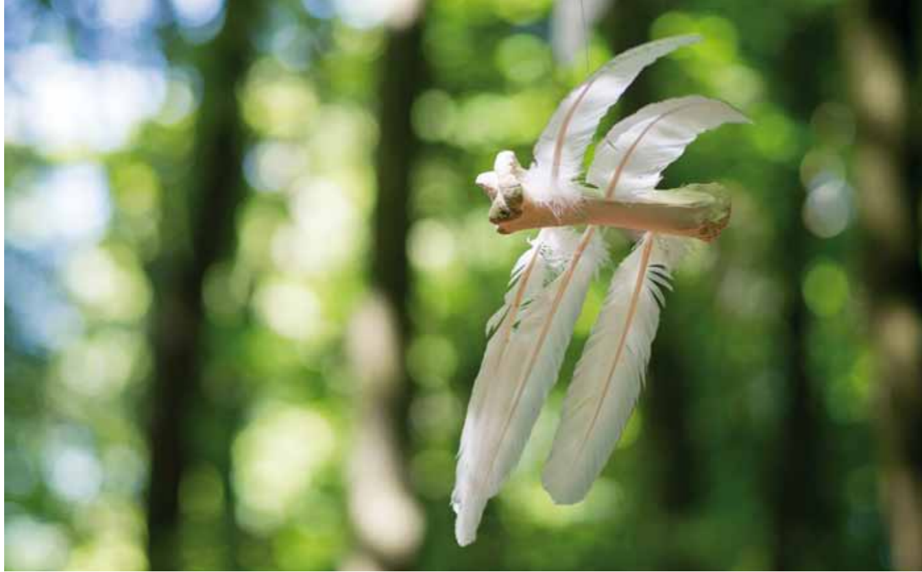
Kathe Wenzel, Knackenvogel (2014). Huesos y plumas / bones and feathers.