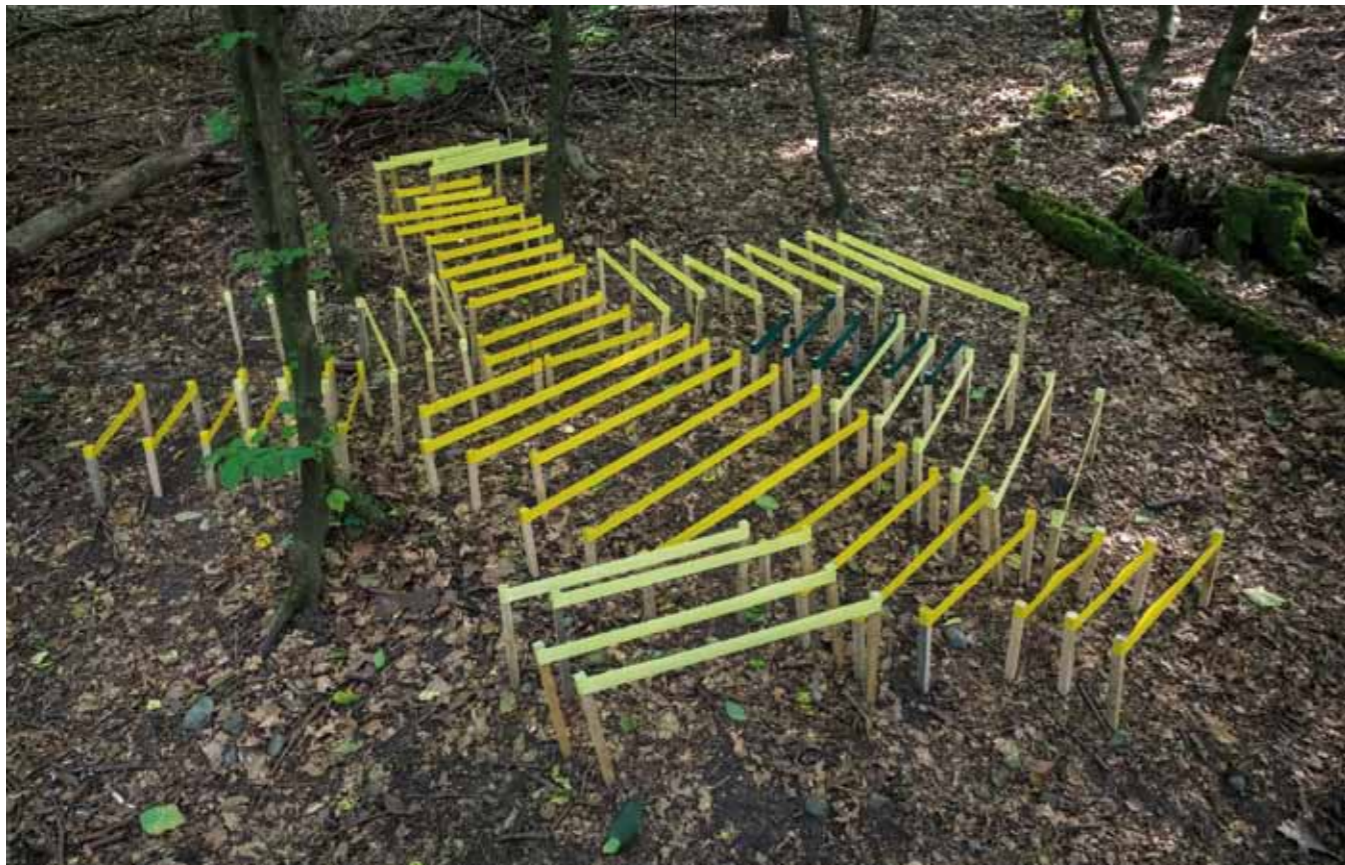
Waltraud Munz, Colonias de primavera - mapa coreográfico / Spring Colonies - A Choreographic Map (2014). Tela coloreada / colored fabric.