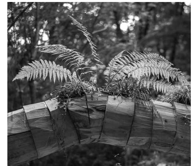
Rumen Dimitrov, Jardines colgantes - Metamorphosis / Hanging Gardens - Metamorphoses (2014). Plantas y madera / plants and wood.